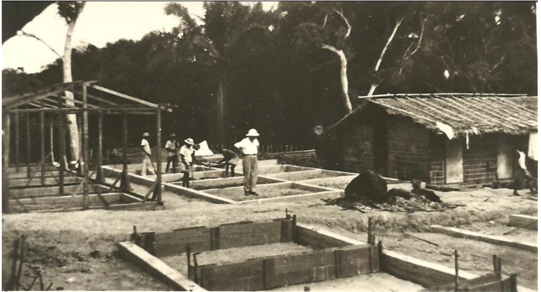
miemas gebouwen worden de oude kamboes houten vervangen in het supra. stap.